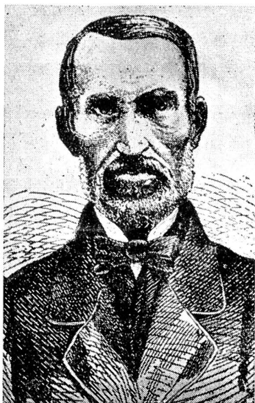
SIMEON BĂRNUȚIU 1808—1864

Adjuncții directorului, doi sau trei, cari eară ar fi montaniști ardeleni, ar avea fiecare 12.000 lei pe an; viaticul încă s'ar da