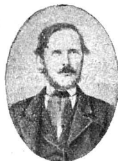
GH. BARIȚ 1812—1893

Dv. ați mai aveà să observați: 1. O grabă mare, pentruca nu cumvã Senatul să se închiză fără veste. — 2. Să tăiați toate acele puncturi care nu vă ating și pe DV. imediate, și să puneți altele, de ex.: Cauza munților DV., dacă aceea încă nu e terminată, ceea ce noi nu știm. (Să lăsați afară de ex.: pp — punctele — însemnate cu Non la margine, — scrie în paranteze Bariț). — 3. Să nu vă prea întindeți la comune multe, două, trei mai mari vecine sânt de ajuns, care apoi să fie reprezentate cel mult de 50 subscripțiuni fruntașe . — 4. Rugămîntea să se compună astădată în limba germană; An den Hohen Reichsrath der Oesterreichischen Monarchie. — 5. Să se trimită la un amic, carele să o dea dea-