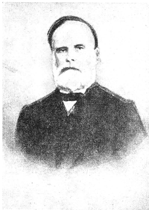
AUG. TREB. LAURIANU 1810—1881

tare. Vodă (Grigore Ghica) e om bun, părtinește tare pe Laurianu, dar mi se pare că numa(i) acesta e pentru el, toți ceilalți atât români, cât și străini în contra lui. Despre intrigile (a)ces-tor dîn urmă scrie Hormuzachi dîn Moldova cătră frate său dîn Viena în următorul înțeles: Consulul muscălesc de aici (dîn Moldova) a înștiințat pe consulul general muscălesc dîn București despre Laurianu că e director peste școalele Moldovei, un